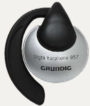
Digta Earphone 957