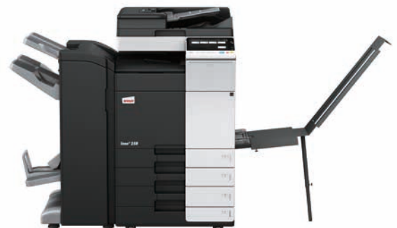
ineo+ 258 mit Dual Scan Originaleinzug (DF-704), Heftfinisher mit Broschüreneinheit (FS-534SD), Bannereinzug (BT-C1e) und Papiereinzug (PC-210)