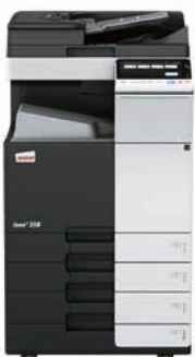
ineo+ 258 mit Dual Scan Originaleinzug (DF-704), Ausgabefach (OT-506) und Papiereinzug (PC-210)

Wenn Sie in eine ineo+ 258 investieren, sind Sie in Bezug auf Spezialaufgaben, wie z. B. auf hochwertigem Karton gedruckte Einladungen, nicht mehr von externen Dienstleistern abhängig. Dadurch sparen Sie Zeit und Geld. Mit der ineo+ 258 können Umschläge, Recyclingpapier, vorbedrucktes Papier, OHP-Folien, viele andere Medien und selbst Karton bis zu einem Papiergewicht von 300 g/m 2 bearbeitet werden. Diese Systeme können zahlreiche Papierformate, von A6 bis A3+ (SRA3), sowie benutzerdefinierte Formate und Banner bis zu einer Länge von 1,2 Metern bedrucken. Außerdem ermöglichen die vielfältigen Endbearbeitungsoptionen das Erstellen bis zu 80-seitiger Broschüren, verschiedene Arten des Brieffaltens, das Heften von Handouts oder Lochen von Rechnungen. Mit einer ineo+ 258 kann fast jeder Druckauftrag intern bearbeitet werden.