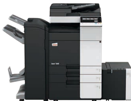
ineo+ 368 mit Dual Scan Original-einzug (DF-704), Heftfinisher mit Broschüreeneinheit (FS-534SD), Großraumfach (LU-302) und Papiereinzug (PC-410)