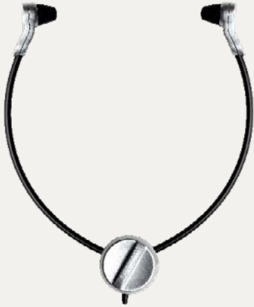
Digta Swingphone 568