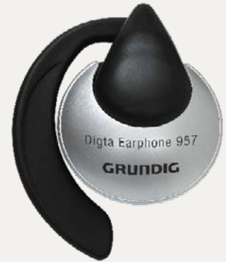
Digta Earphone 957