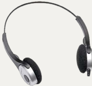
Digta Headphone 565