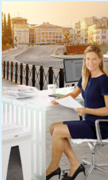
Schredder & Aktenvernichter