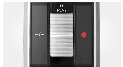
Schiebeschalter-Bedienung (schneller Vorlauf, Wiedergabe/Aufnahme, Stopp, schneller Rücklauf)