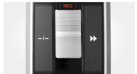
Schiebeschalter-Bedienung (Aufnahme, Stopp, Wiedergabe, Rücklauf)