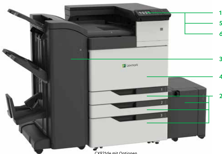
CX921de mit Optionen

Drucken Sie Microsoft Office-Dateien, PDFs und andere Dokument- und Bildarten von Flash-Laufwerken, oder wählen Sie Dokumente auf Netzwerk-Servern oder Online-Laufwerken aus und drucken Sie sie.