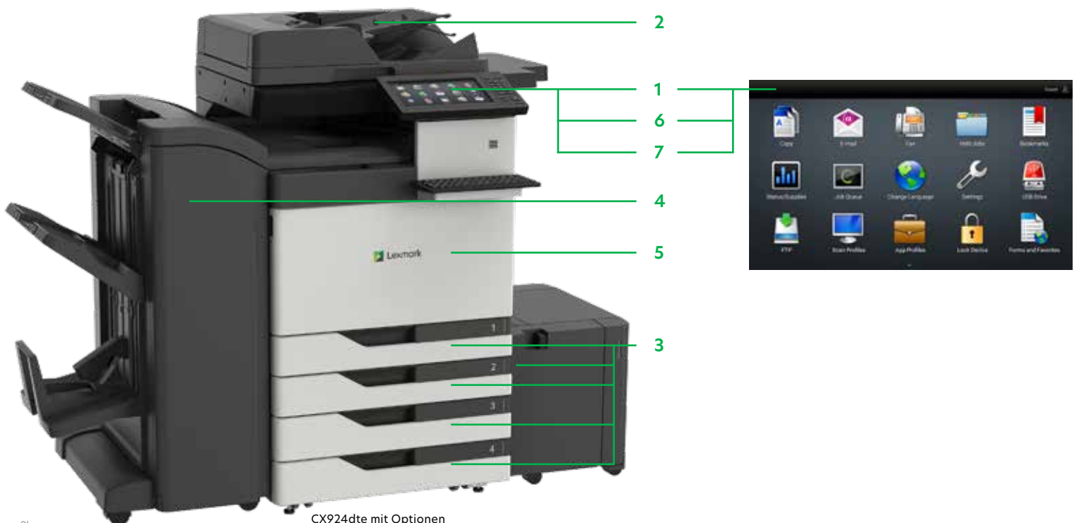
CX924dte mit Optionen

Drucken Sie Microsoft Office-Dateien, PDFs und andere Dokument- und Bildarten von Flash-Laufwerken oder wählen Sie Dokumente auf Netzwerk-Servern oder Online-Laufwerken aus und drucken Sie sie.