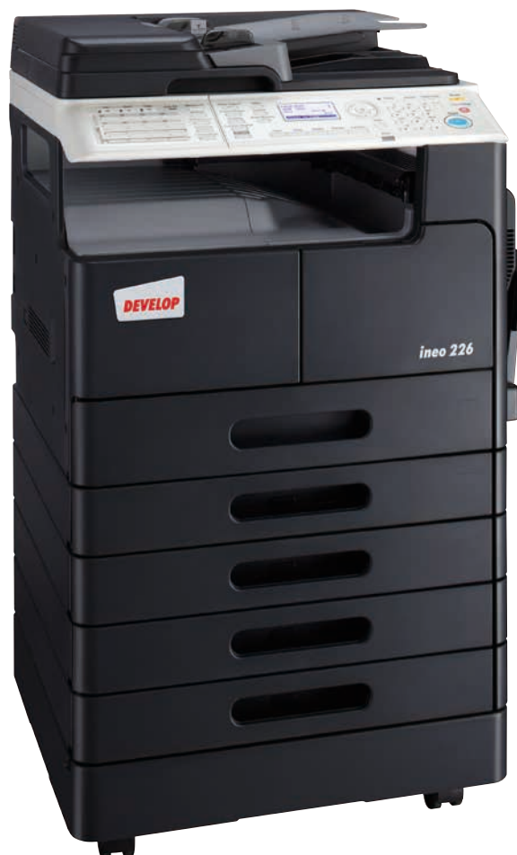
ineo 226 mit Duplex-Origineleinzug (DF-625), Faxfunktionalität, Duplexeinheit (AD-509), zusätzlichen Papierkassetten (PF-507) und Unterstand (DK-708)

Benutzer sind oftmals überfordert, wenn es um die Bedienung moderner Büro-Multifunktionsgeräte geht. Auch hier ist die ineo 226 erfreulich anders, da sie speziell für die einfache Bedienung konzipiert wurde. Der Anwender hat dank des übersichtlichen Displays alles klar im Blick, wird leicht durch das Menü geführt und kann schnell auf alle Funktionen zugreifen.